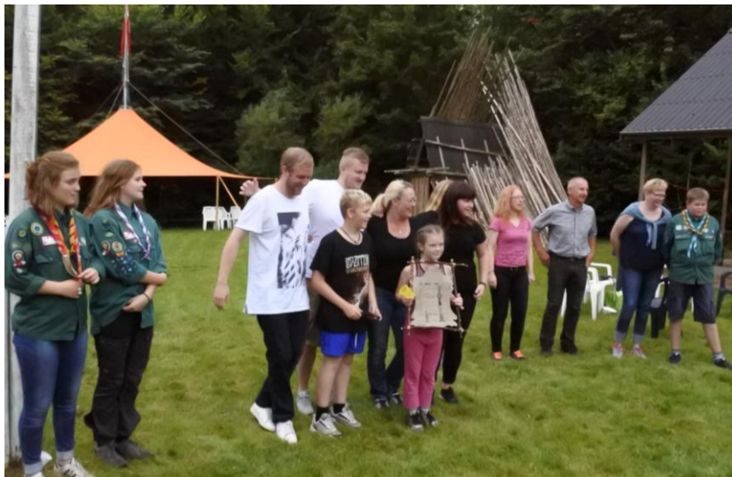
Vinderne fra familieløbet 2016

Indbydelse til dette første arrangement udsendes efter ferien.