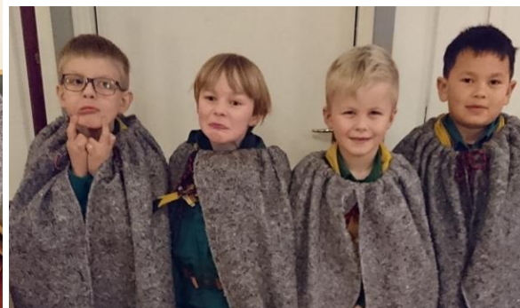
Bæverne har syet og malet bålkapper