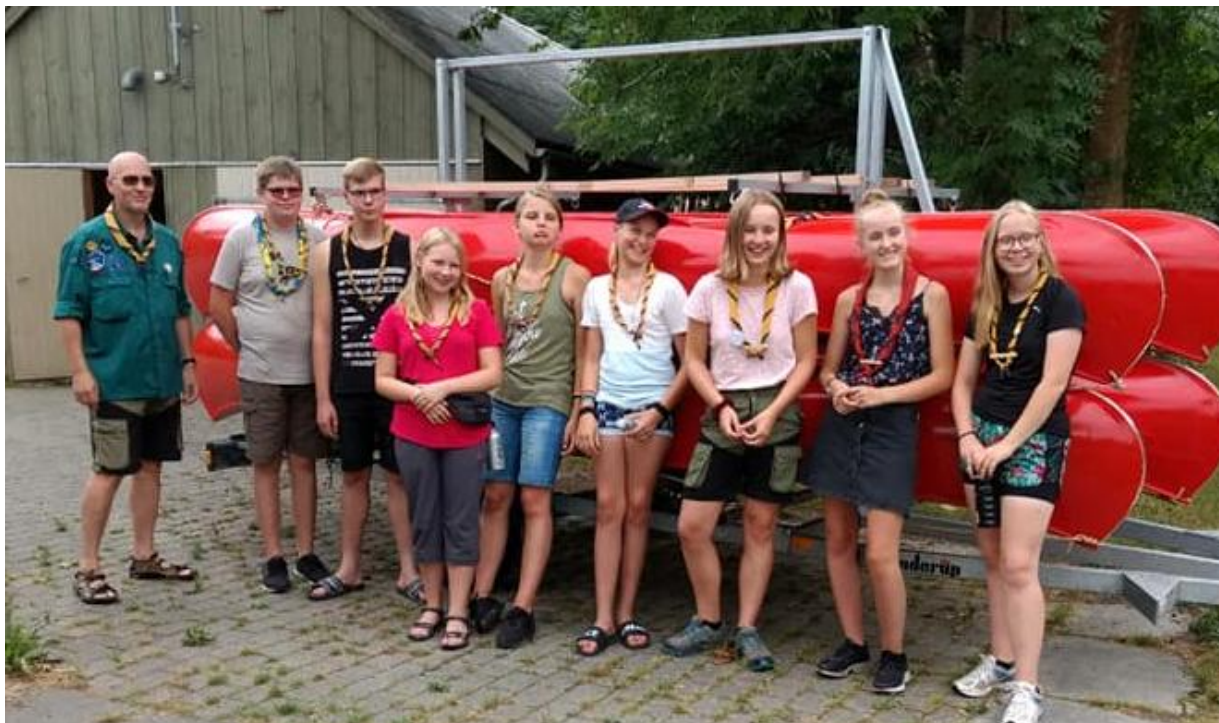
Seniorene er klar til kanotur på Gudenåen