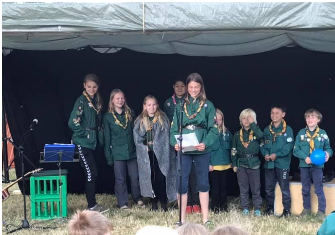
Høruphav gruppe optræder med Maries historie til lejrball på lejren