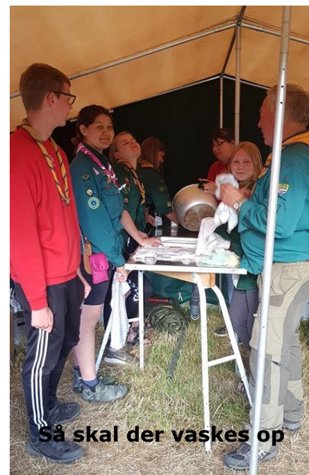
Så skal der vaskes op