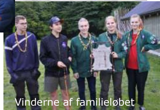
Vinderne af familieløbet