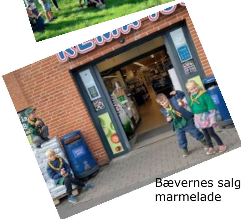
Bævernes salg af marmelade